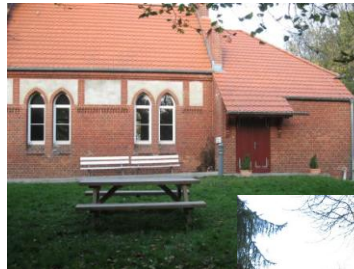
Kapelle im Grünen Greifswalder Hospiz Ellerholzstraße 1-2 17489 Greifswald