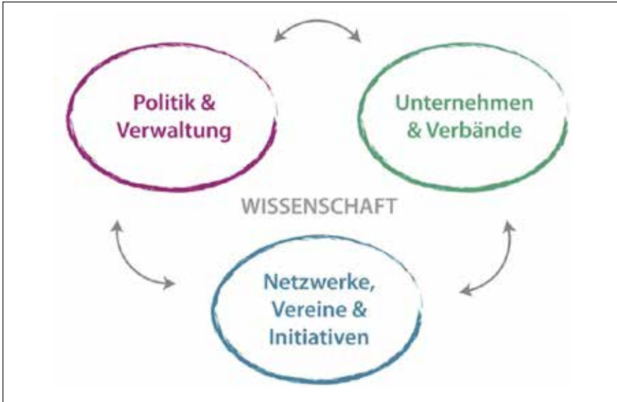
Abb. 1 Die Akteursgruppen (eigene Darstellung)

lich einer gemeinsamen Ausstellung zu negativen Umweltauswirkungen auf die Astronomie die „Declaration on the Reduction of Adverse Environmental Impacts on Astronomy“ unterzeichneten (Teilnehmer der UNESCO/IAU/ICSU Exposition 1992). Darin wird der Nachthimmel als „precious treasure of all humanity“ identifiziert und festgehalten, dass dieser aufgrund zivilisatorischer Auswirkungen zunehmend verdeckt wird. Die UNESCO, andere Organisationen und die UN-Mitgliedsstaaten werden aufgerufen, Maßnahmen zum Schutz des Nachthimmels und der Sternwarten zu ergreifen – vorgeschlagen wird u.a., die bedeutendsten Observatorien unter den Schutz des Welterbes zu stellen.